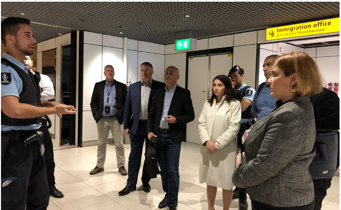
საქართველოს დელეგაცია სხიპჰოლის აეროპორტში, ნიდერლანდებში Georgian delegation at Schiphol Airport, the Netherlands

The main advantage of using these systems is that agencies can access passenger data at varying points in time prior to their arrival at the country's airports and then assess risk and plan interventions accordingly. API data consist