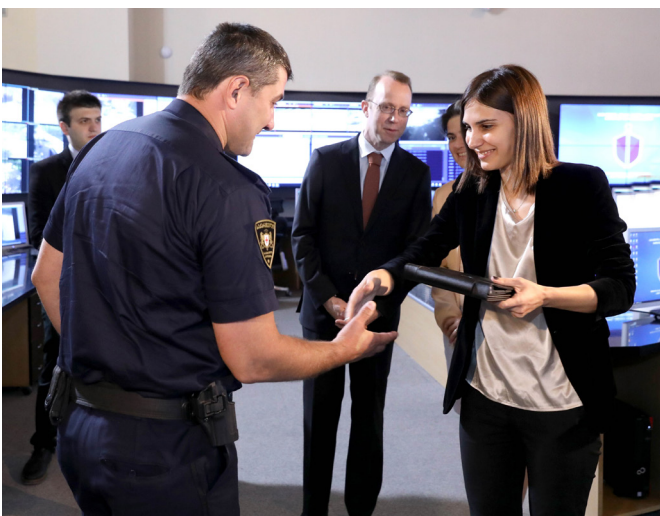
შინაგან საქმეთა მინისტრის მოადგილის მიერ საპატრულო პოლიციის ოფიცრებისთვის პლანშეტურ კომპიუტერების გადაცემა Deputy Minister of internal Affairs of Georgia handing the computer tablets to Patrol Police officers

ევროკავშირი და IOM მხარს უჭერენ საქართველოს შინაგან საქმეთა სამინისტროს (შსს) ოპერატიულ ინფორმაციაზე დაყრდნობით პოლიციის საქმიანობის