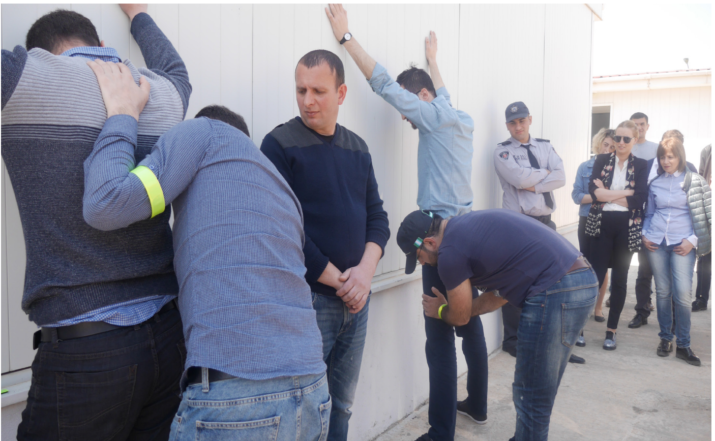
ტრენინგის მონაწილეები შემოსავლების სამსახურიდან დათვალიერების ტექნიკურ უნარებს პრაქტიკაში იყენებენ Trainees of Georgian Revenue Service Practice their search skills